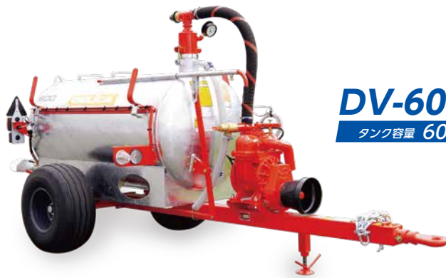
DV-605T タンク容量 600L