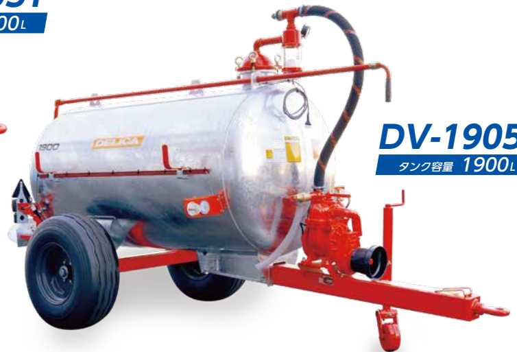
DV-1905T タンク容量 1900L