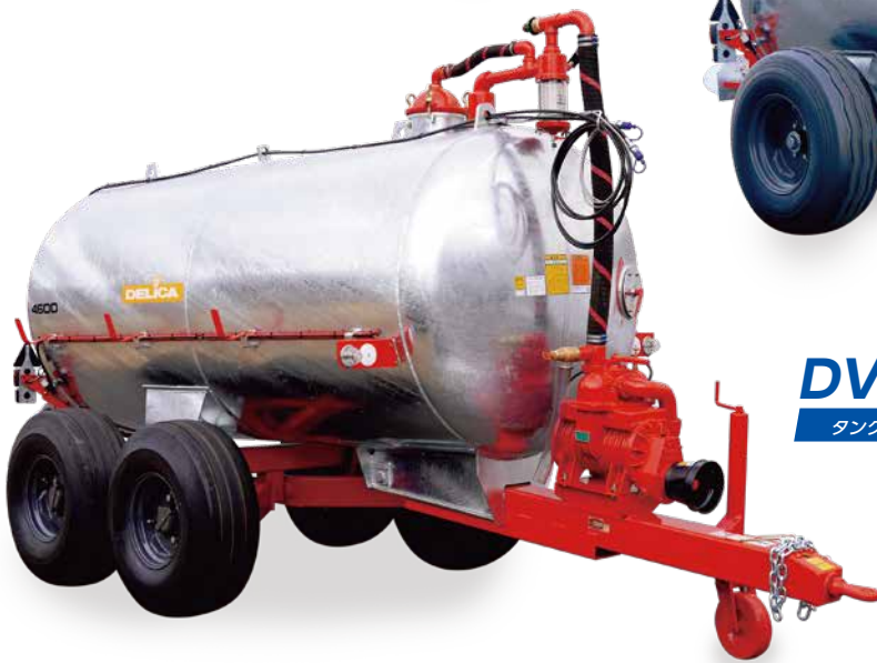
DV-4605T タンク容量 4600L