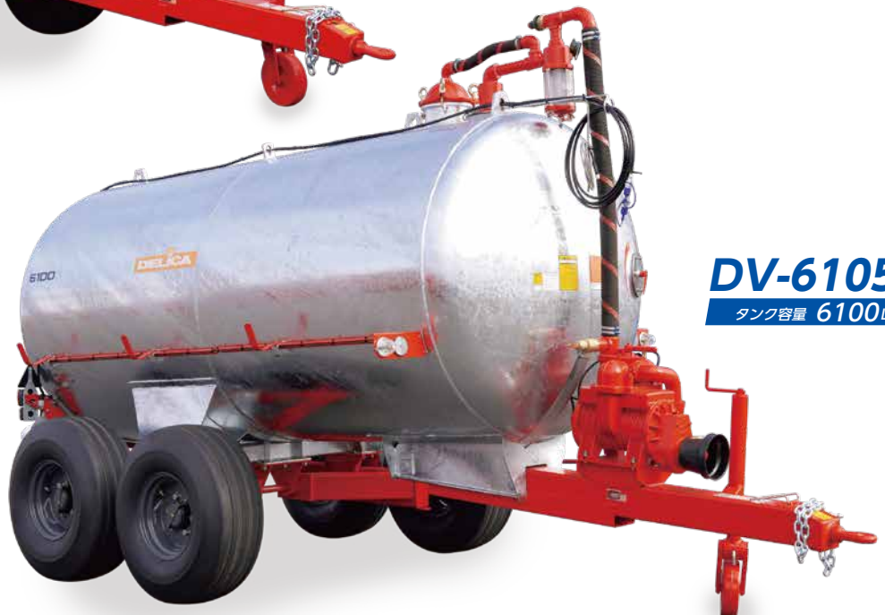
DV-6105T タンク容量 6100L